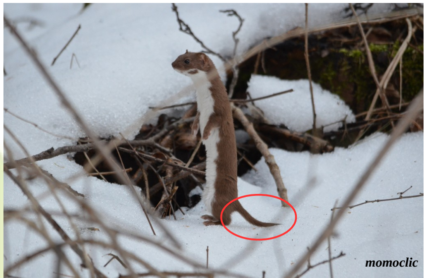
La Belette d'Europe ( Mustela nivalis )