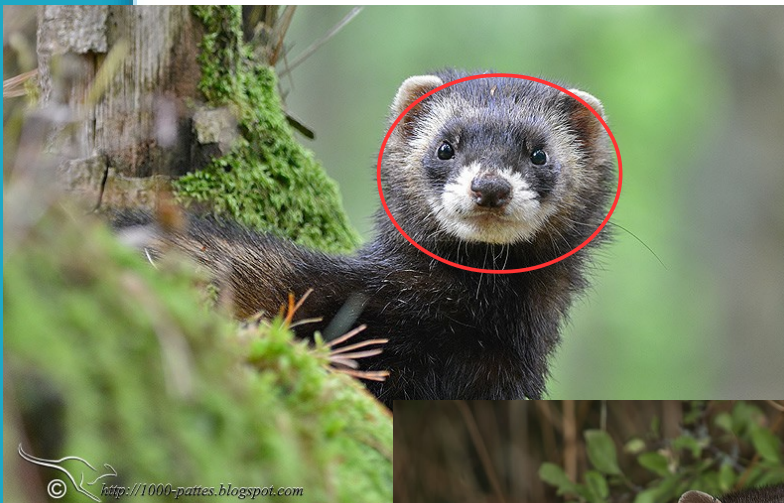
Le Putois d'Europe ( Mustela putorius )

En ce qui concerne la Fouine et la Martre , toutes deux peuvent être confondues. Cependant, à la différence de la Martre, la Fouine possède une tâche blanche qui s'étend jusqu'aux pattes. La Martre quant à elle possède une tâche souvent jaunâtre voir orangée couvrant uniquement la gorge.