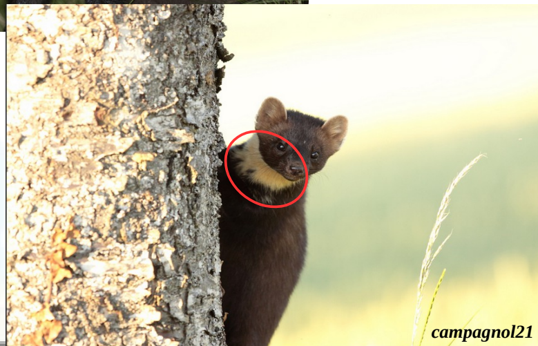
La Martre des pins ( Martes martes )