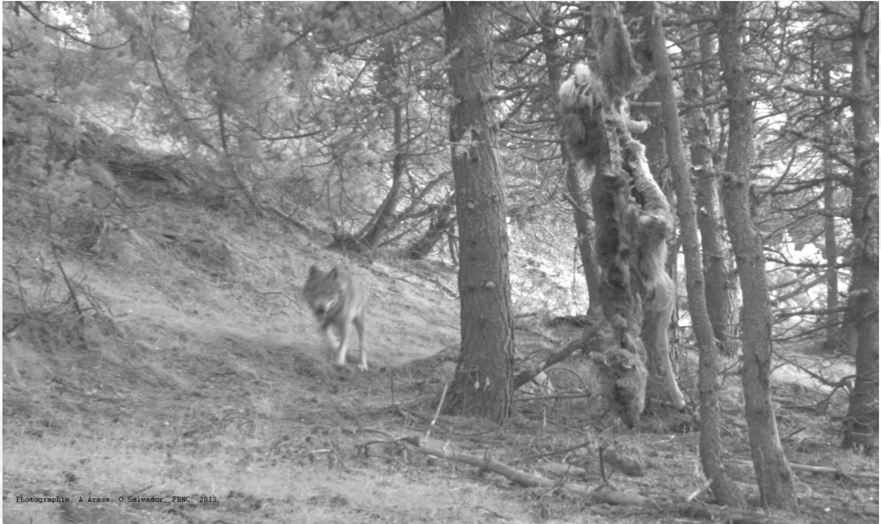
Photographie: A. Arasa, O. Salvador, FRNC. 2013